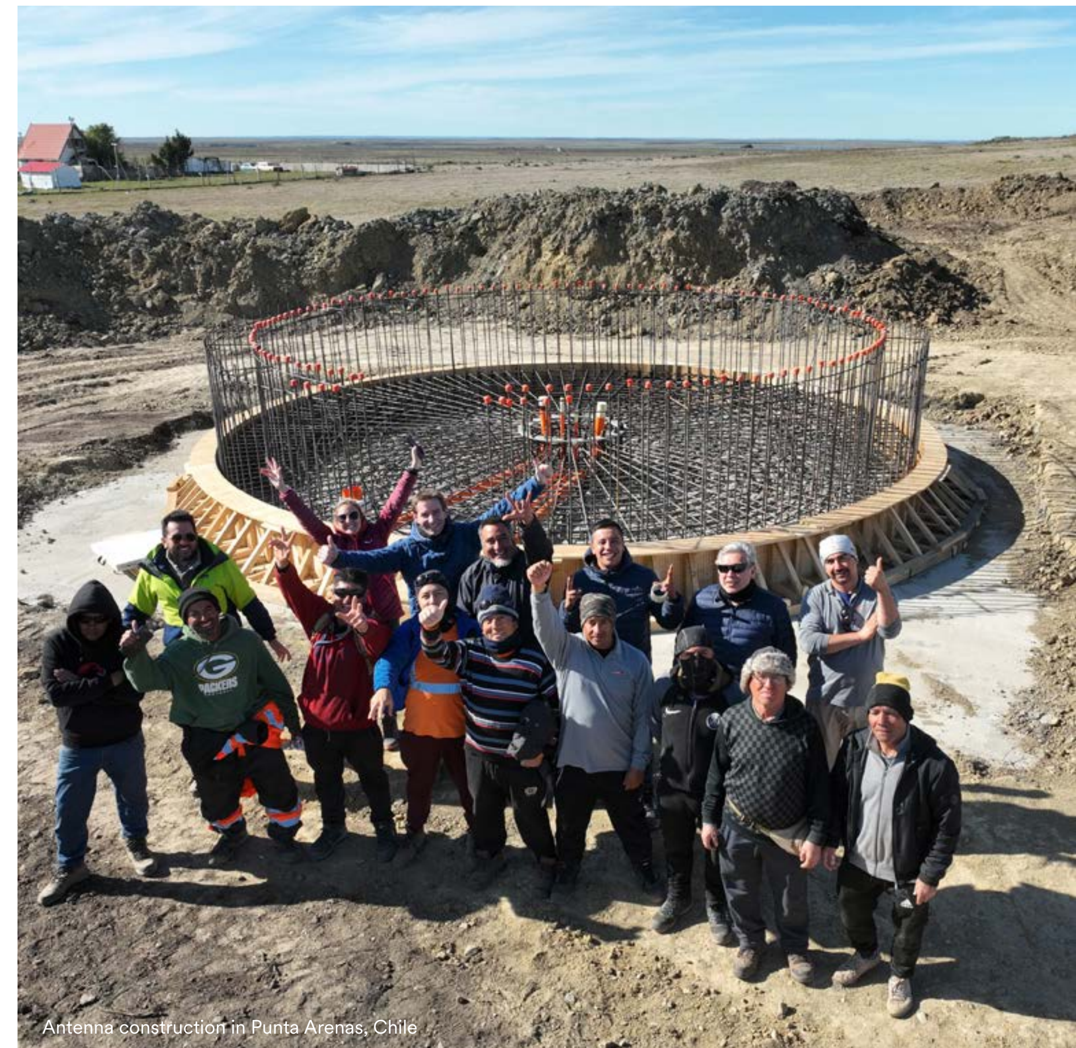
Antenna construction in Punta Arenas, Chile

I regeringens proposition 2024/23:34 Totalförsvaret 2025-2030: "Rymdbasen Esrange Space Center utgör en resurs ur ett försvars- och säkerhetsperspektiv, dels i och med uppskjutningsförmåga av satelliter, dels i och med den geografiska närheten till Nordkalotten och Arktis", samt "Förmåga till säker satellitkommunikation med täckning över Arktis bör utvecklas tillsammans med allierade".